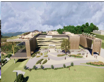
< 갯벌 치유센터 조감도 >