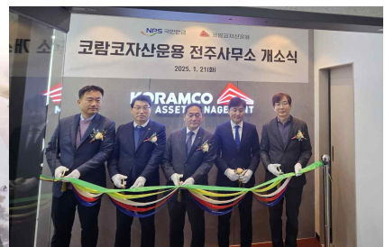
<코람코 자산운용사 유치>