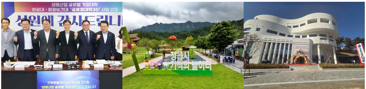
< 24년 글로벌컬대학 30 (원광대+원광보건대) 최종선정 >