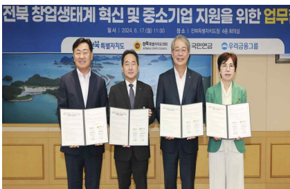
< 금융산업 육성협력을 위한 (도-우리금융-국민연금공단) 협약 >