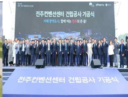
< 전주전시컨벤션센터 건립 기공식 >