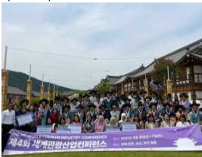
< '25 세계관광산업컨퍼런스 >