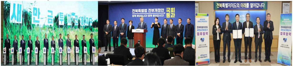
< 새만금 투자진흥지구 지정 >