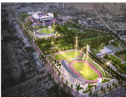
< 전주 월드컵 스포츠타운 육상경기장, 야구장 착공 >