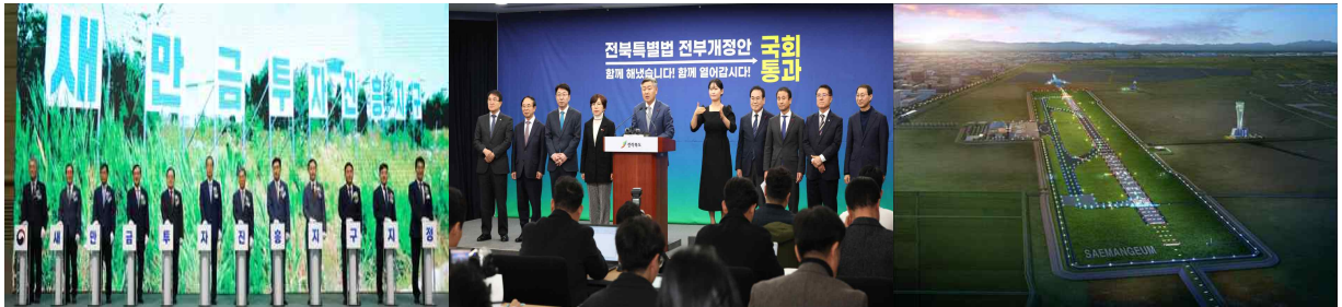
< 새만금 투자진흥지구 지정 >