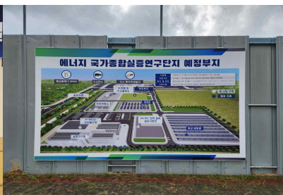
< 재생에너지 국가종합실증 연구단지 실증연구동 착공 >