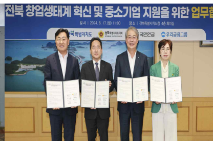
< 금융산업 육성협력을 위한 (도-우리금융-국민연금공단) 협약 >