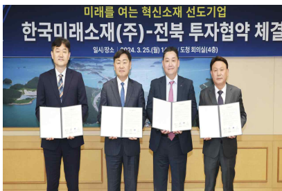
< 한국미래소재 유치 >