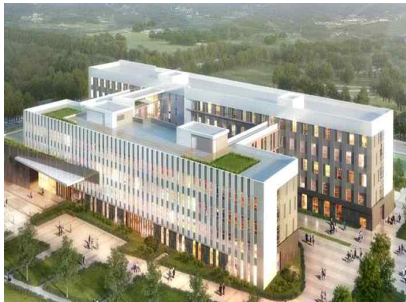
< GMP기반 농축산용 미생물산업화지원시설 >