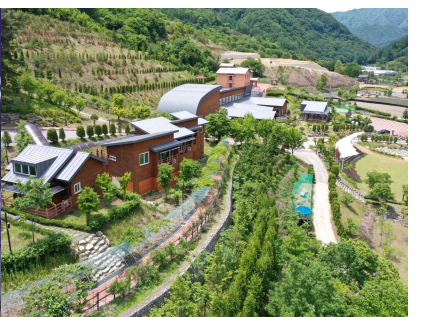
< '24 전북형 치유관광지 선정 >