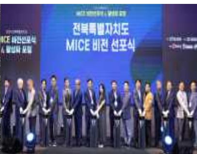
< 전북 글로벌 마이스 비전선포식 >