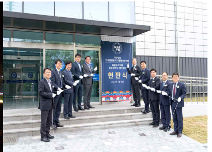
< 동물용 의약품 효능·안전성 평가센터 완공 >