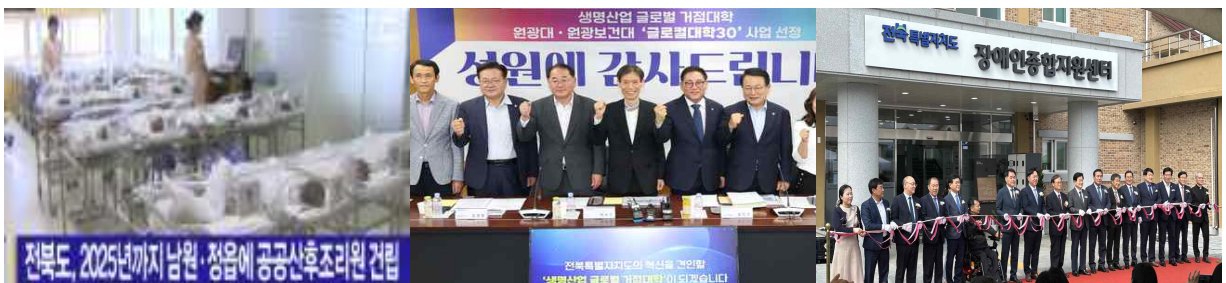
< 공공산후조리원 건립 >